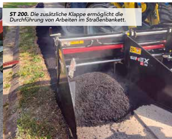
ST 200. Die zusätzliche Klappe ermöglicht die Durchführung von Arbeiten im Straßenbankett.